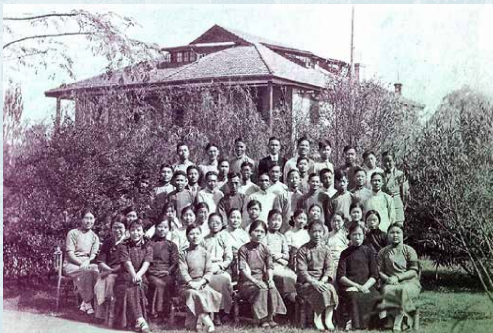
1935年，上海伯特利聖經學院神學生（攝於伯特利大院之禮拜堂前）