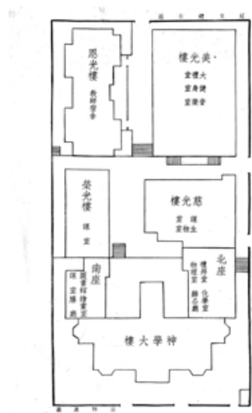
圖 6.2 香港伯特利院子平面圖，繪於 1965 年，位於嘉林邊道

1952 年，因內地時局緊張，香港遷移外國者眾，遂有人建議將伯特利遷往印尼。但他們經過禱告後，領受神的旨意，決定不但不遷，還要增建房屋。與此同時，在 1952 及 1954 年，得蒙美國一位姊妹兩次奉獻，合共美金 12 萬，伯特利以此款項先後興建「榮光樓」（1954）、「恩光樓」（1956）及「美光樓」（1958），而美光樓也用作紀念 1954 年 12 月 29 日安息主懷的石美玉醫生。 6 自此，嘉林邊道伯特利院子，包括原有的「神學大樓」，共有樓宇五座（圖 6.2）。