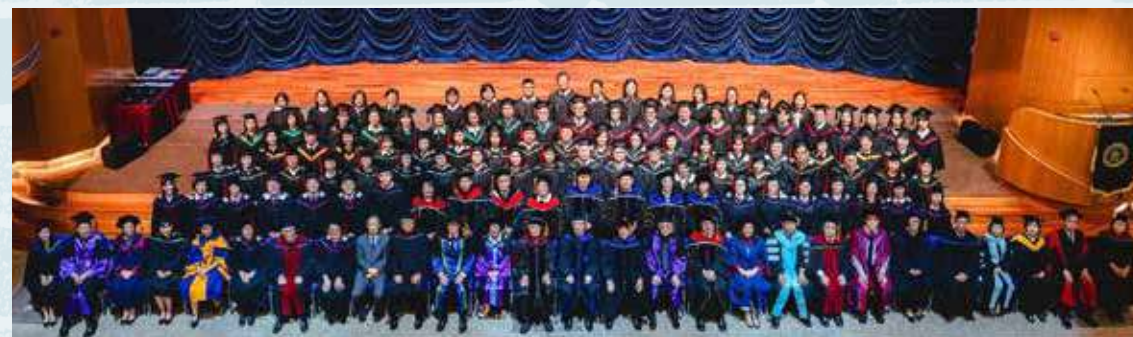
2024年，伯特利神學院畢業典禮