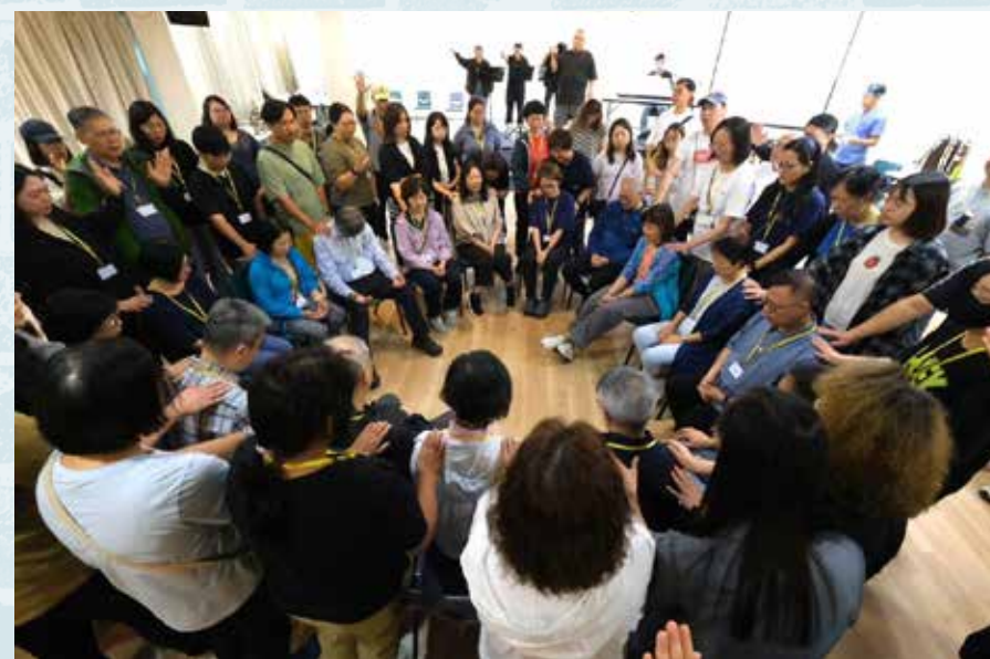
2024年，伯特利神學院開學營