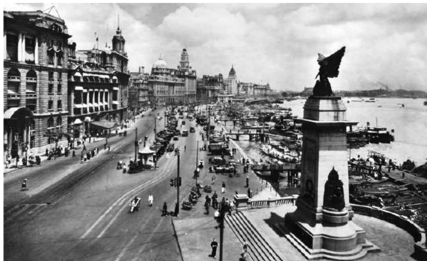
圖 1.1 1928 年的上海外灘