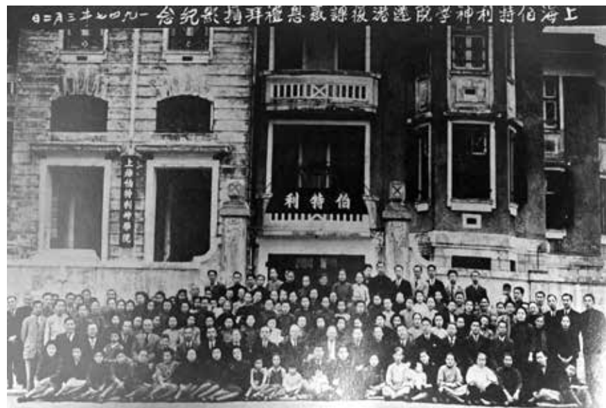
圖 6.1 1947 年 3 月 2 日，伯神遷港復課感恩禮拜合照