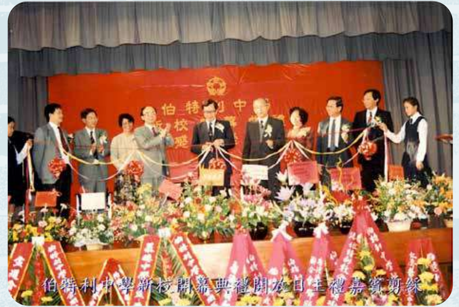
1990年，元朗新校舍開幕典禮