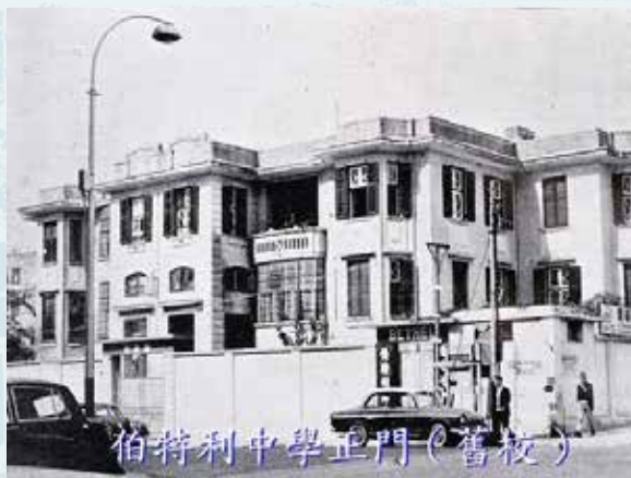
嘉林邊道舊校舍正門