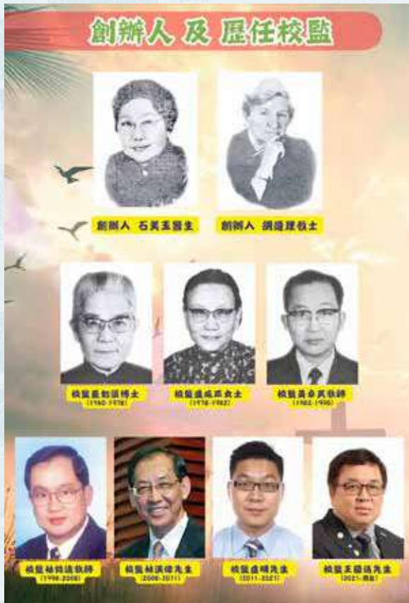
伯特利中學創校元老及歷任校監