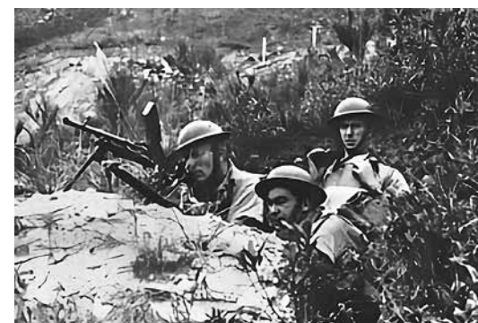
在陣地上抵抗日軍的加拿大籍英軍