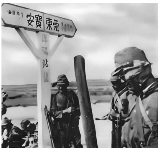
日軍在進攻香港之前，已經佔領廣州、寶安（深圳）一線