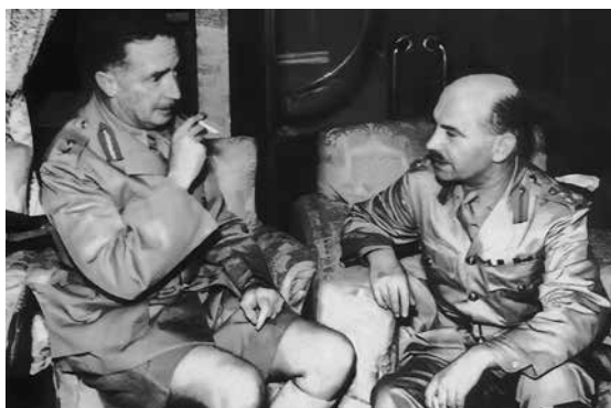
香港保衛戰中，駐港英軍司令馬爾比少將（左）與加拿大援軍指揮官勞森準將交談