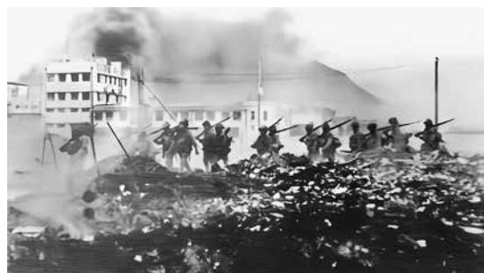
日軍在香港北角登陸