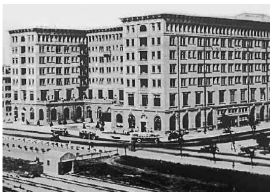
位於香港尖沙咀的半島酒店