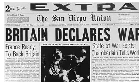
刊登英國向日本宣戰消息的報紙