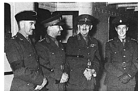
英軍勞森準將（左二）