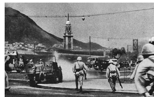
日軍攻陷香港尖沙咀