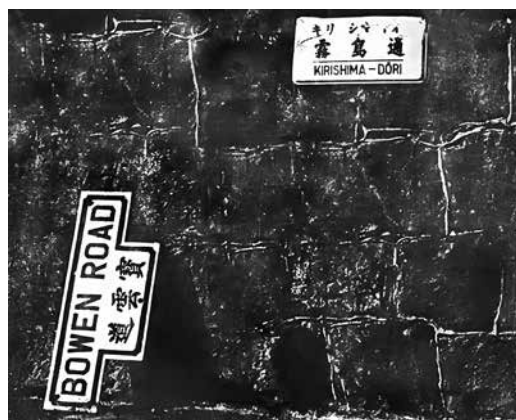
日本佔領香港後，將道路改名

區 4 個警備隊；新界地區的警備隊分駐粉嶺、安樂村、元朗洪水橋、沙頭角、金錢圍、沙田、大嶼山等地，約 800 人。日軍在香港沿海有大小機帆船百餘艘、港內戰艦及小炮艇若干艘，歸華南第二遣華艦隊司令部指揮。