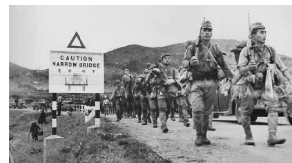
日軍攻佔香港進軍途中

據戰後的香港口述歷史調查，這些「勝利友」人數高達上千。他們瘋狂洗劫金鋪、士多店和商場，並闖進平民家中。如果有人拒不交出保險櫃的鑰匙，會被當場砍斷手臂；找不到錢的士多店，會被一把火燒掉，反抗者會被推進火堆活活燒死；甚至有不同幫派因為搶劫同一個金鋪互相火併。野口捷三混合挺進隊佔領九龍市區後，鎮壓了本來支持日軍的漢奸「勝利友」，並在主要道路設立崗哨，控制了九龍市區。