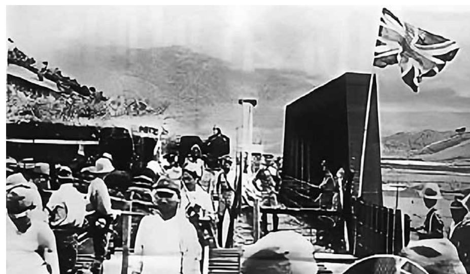
日軍進攻香港前夕，與英軍在羅湖橋對峙

英國在遠東支持日本對華侵略。第一次世界大戰結束後，英、法、意等國與日本簽署祕密協議，允許日本繼承德國在中國山東省的權益。然而養虎為患，英美等西方諸國最終也成為日本軍國主義的戰爭對手。