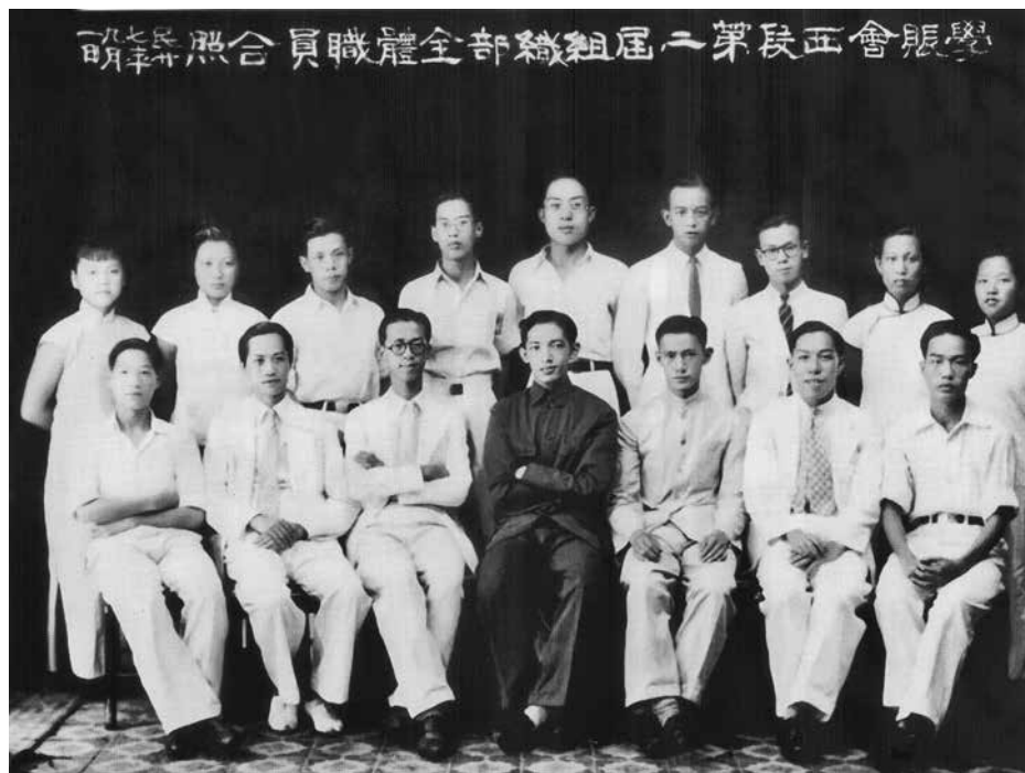
1938 年 9 月，香港學生賑濟會成員合影

早在 1935 年就成立的餘閑樂社，原是海員群眾組織，後來聯合組織香港海員工會，接受中共香港市委領導；1937 年後，會員多達 2 萬餘人。香港愛國青年學生成立香港學生賑濟會（簡稱「學賑會」），以節食、節用、賣