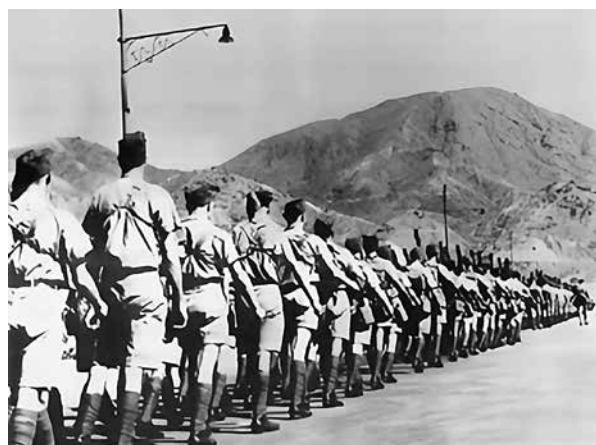
加拿大兩個營的援軍抵達香港

計劃。但是，這個建議遭到英國首相丘吉爾的反對。丘吉爾認為，香港必須保衛。因此，香港防禦繼續按計劃進行。