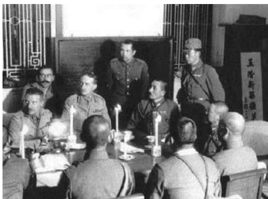
1941年12月25日，港督楊慕琦在香港半島酒店向日軍投降