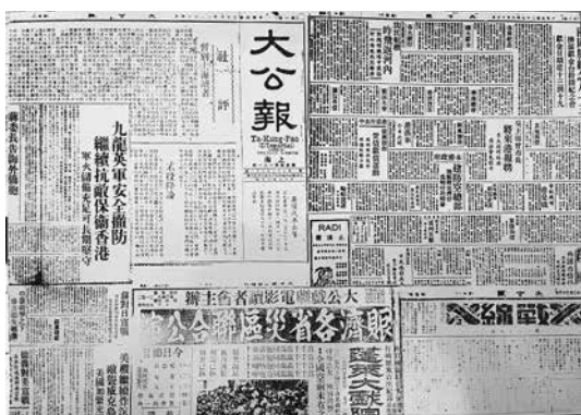
《大公報》對防守九龍的英軍撤防的報道

該聯隊第三大隊向 255 高地進攻，第二大隊向城門河進攻。經過激烈交火，城門碉堡失守。12 月 10 日凌晨 3 時左右，守軍 A 連連長鐘斯上尉向日軍投降。守衛碉堡指揮所的 20 人中，6 人受傷，兩名印度籍士兵陣亡。城門碉堡失陷將近 15 小時後，12