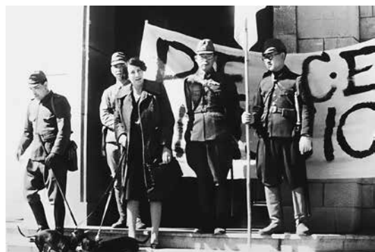
日軍首次勸降團成員