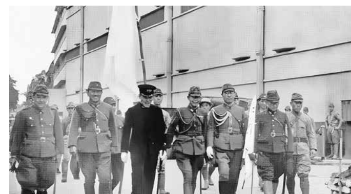
佔領香港的日本軍官