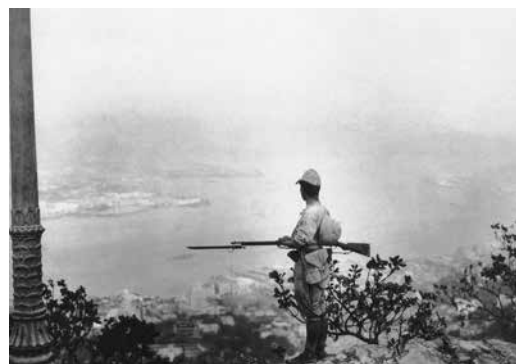
佔領香港的日軍哨兵在太平山上

憲兵本部設在香港本島中區，內設警務課、經理課、醫務課。九龍憲兵總部設在九龍，各區分別設憲兵隊、派遣隊或派出所。此外，還設有水上憲兵隊，分為香港和九龍兩隊。全港九的日本憲兵約 150 名，由華人、印度人組成的憲查約 2000 名。翻譯（又稱「通譯」）大多為有軍籍的台灣人。