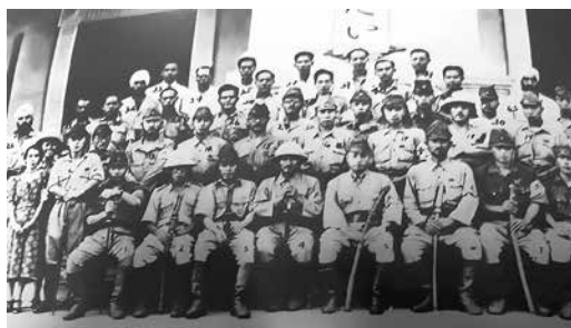
佔領香港的日本憲兵

區 4 個警備隊；新界地區的警備隊分駐粉嶺、安樂村、元朗洪水橋、沙頭角、金錢圍、沙田、大嶼山等地，約 800 人。日軍在香港沿海有大小機帆船百餘艘、港內戰艦及小炮艇若干艘，歸華南第二遣華艦隊司令部指揮。