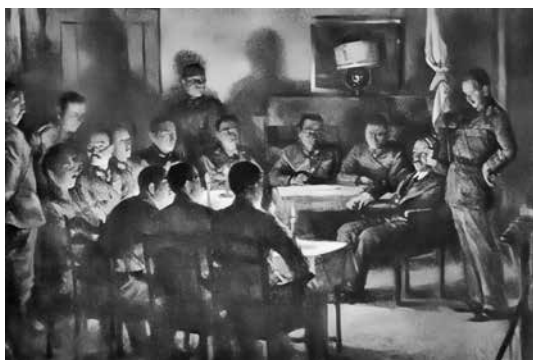
描繪港督向日軍投降場景的畫作