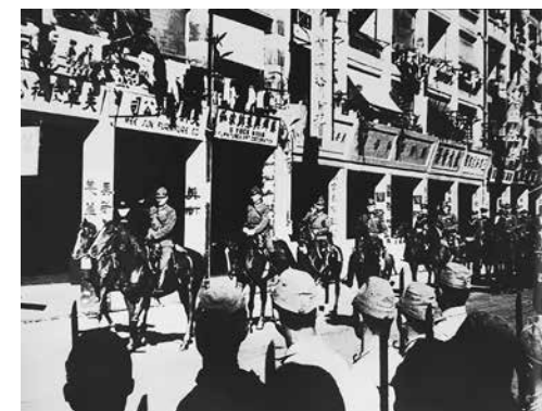
日軍舉行佔領香港入城式

寒意。陰天從午後開始轉晴，強烈的陽光穿透厚厚的雲層，萬道金光照射着下午的街道，這是戰史的輝煌時刻，我軍開始舉行入城式。