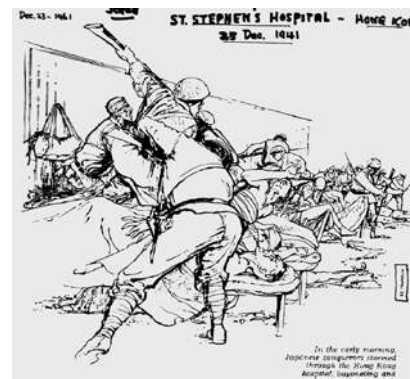
反映日軍屠殺聖斯提反學院臨時醫院英軍傷兵的美術作品

12月28日中午12時30分，攻佔香港的帝國陸海軍部隊，在敵人投降之後，解除了敵人的武裝，26日下午6時，我軍佔領香港全島。昭和十六年（1941年）12月28日，南方的早晨仍有