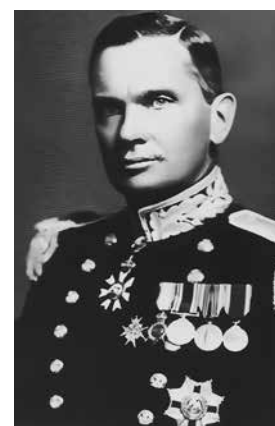
時任香港總督楊慕琦