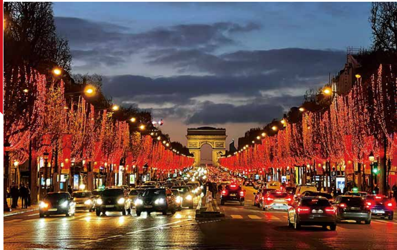
凯旋门和笔直宽阔的香榭丽舍大道，灯火璀璨

面流光溢彩；蒙马特高地上的圣心大教堂则熠熠生辉，仿佛守护着这片灯火辉煌的土地；闪烁着点点星光的埃菲尔铁塔，更是整座城市的焦点。