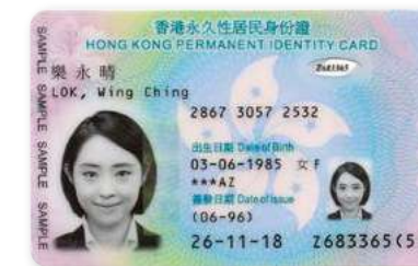
▲ 圖 27-7 新增多項防偽特徵，並提升晶片和保障個人資料的技術。