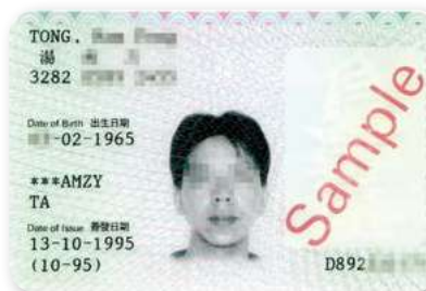
▲ 圖 27-5 分為香港永久性居民身份證及香港居民身份證兩類，此階段的身份證使用時間很長，橫跨 1997 年回歸前後。