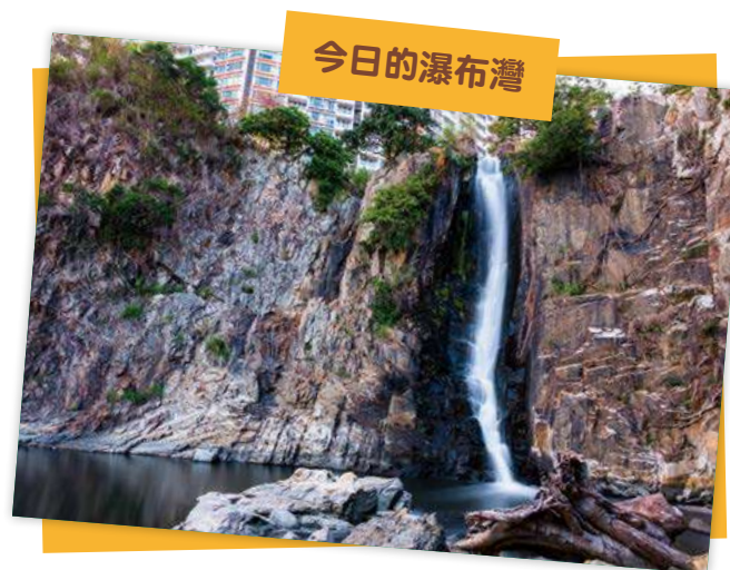
▲ 圖 1-2 瀑布灣的瀑布高約 10 米，水源來自薄扶林水塘。

在薄扶林有一條清溪（相傳就是現在的瀑布灣），由山上流至大海，水質甘甜，是遠洋船旅取水補給之地。這條清溪稱為「香江」，而由清溪流出大海的港口，就稱為「香港」。