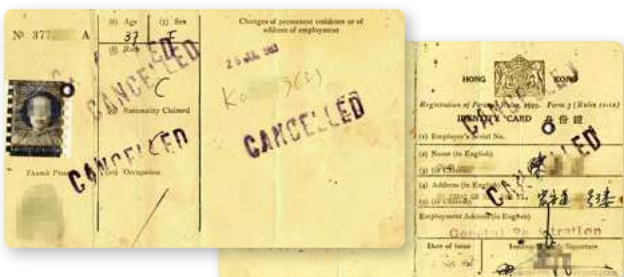
▲ 圖 27-1 除個人的基本資料外，亦有住址、工作地址、職業等。有黃、粉紅和淺藍三種顏色。