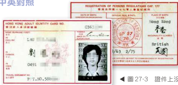
▲ 圖 27-3 證件上沒有指模，新增了中英對照語言和出生地點，兒童身份證開始有相片和全名。