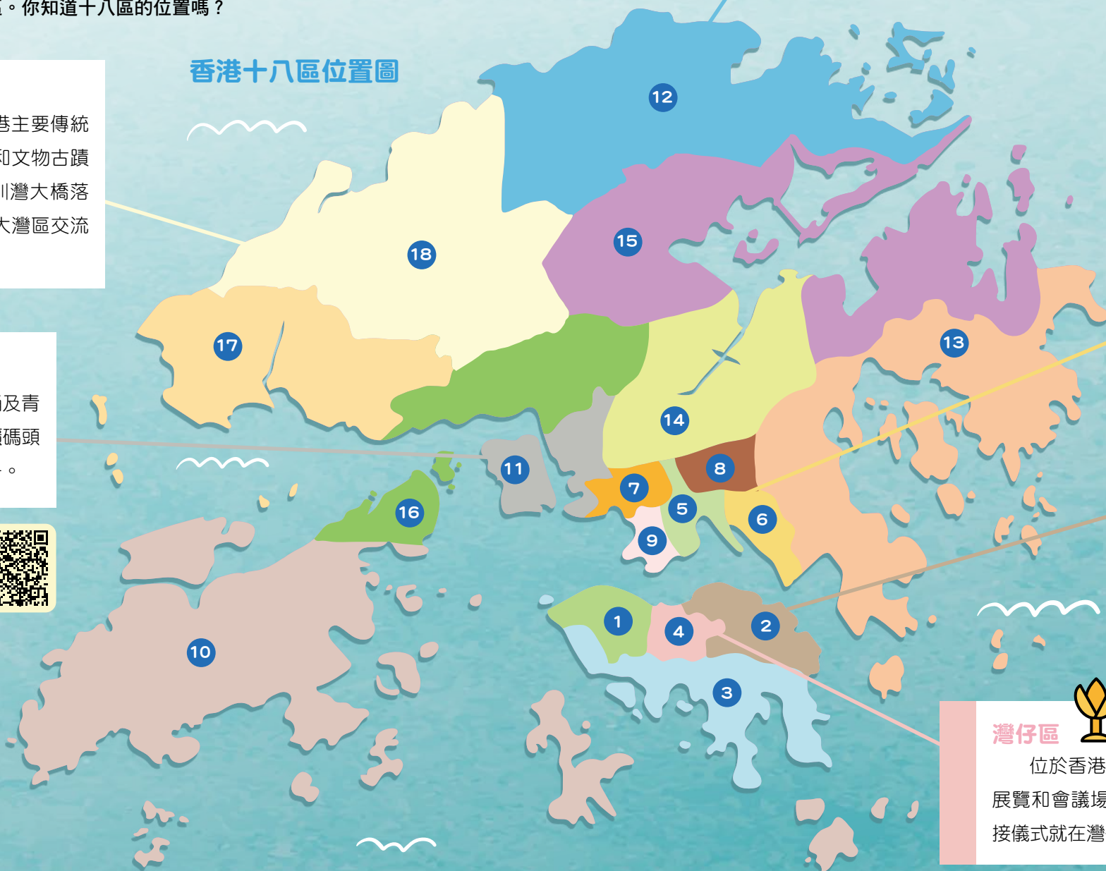
香港十八區位置圖