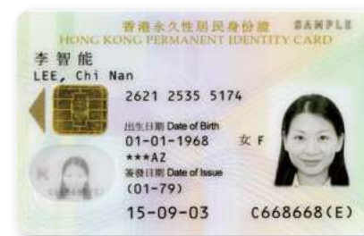
▲ 圖 27-6 新增儲存指模及個人資料的晶片，為 2004 年推出自動過關系統奠下基礎。