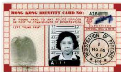
▲ 圖 27-2 新增左手指模，持證人的資料及其他個人資料則載於證件背面。兒童身份證只顯示姓氏，沒有相片及名字。