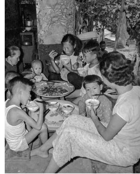
▲圖31-1 二戰結束後香港出生率上升，漁民家庭擁有八至十個小孩是普遍現象。（攝於1955年）

「嬰兒潮」（baby boom）指的是出生率突然大幅度上升的現象。1945年第二次世界大戰結束，世界恢復和平狀態，觸發全球出現嬰兒潮，世界各地出生率大幅上升，香港也不例外。這一代的嬰兒成長後成為香港的棟樑，是1970年代香港經濟起飛的主要力量。