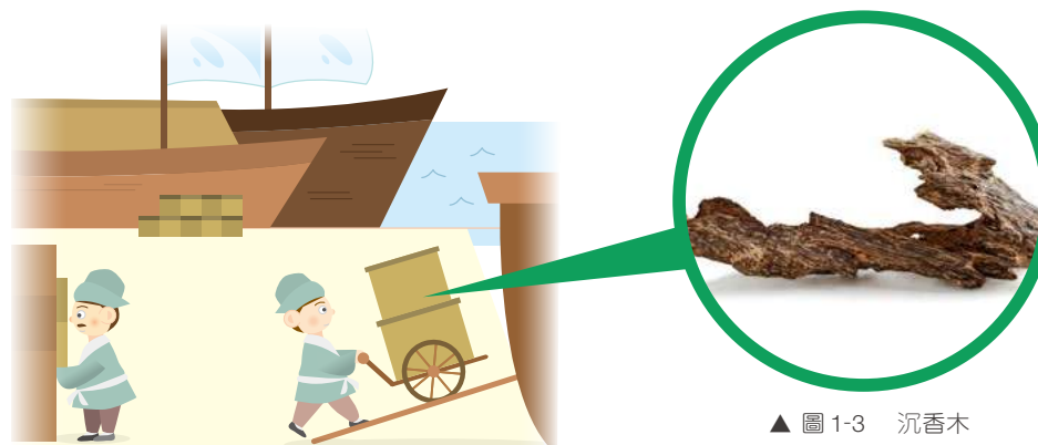
▲ 圖 1-3 沉香木

華南盛產香木（莞香），產品多由省城運至港島石排灣，轉以艚船（木船）再分銷各地，由於香港曾作為香木販運的中心，故被稱為「香港」。考查「香港」一名最早見於明代，其時確是香業運輸之高峰時期，「運香港口」的說法有一定可信性。