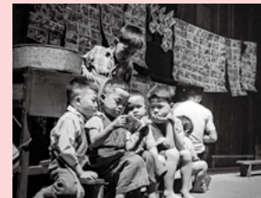
▲圖31-2 昔日兒童在街上看「公仔書」。