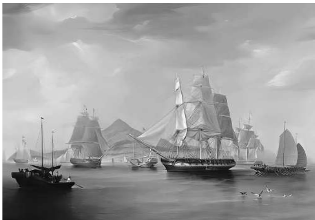
伶仃洋上的販運鴉片的船隻

伶仃洋鴉片貿易的出現，使鴉片貿易進入了高峰期，為了適應走私，鴉片販子在運輸工具上推陳出新。