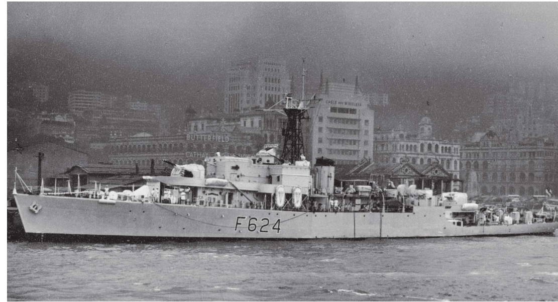
○ 在添馬艦海軍基地停泊的莫克姆灣號 (HMS Morcombe Bay)

在 1951 年至 1953 年間，國軍閉關政策的高峰時，共有 141 次英國商船被襲的報告，引致 4 人受傷、1 人死亡。以英國貨輪奈格洛克號 (SS Nigelock) 的遭遇為例，在 1953 年 8 月貨輪由上海往廈門途中，在烏坵嶼東南對開 40 里被國軍的軍艦截查，在港的護衛艦聖布賴茲灣號立即前往