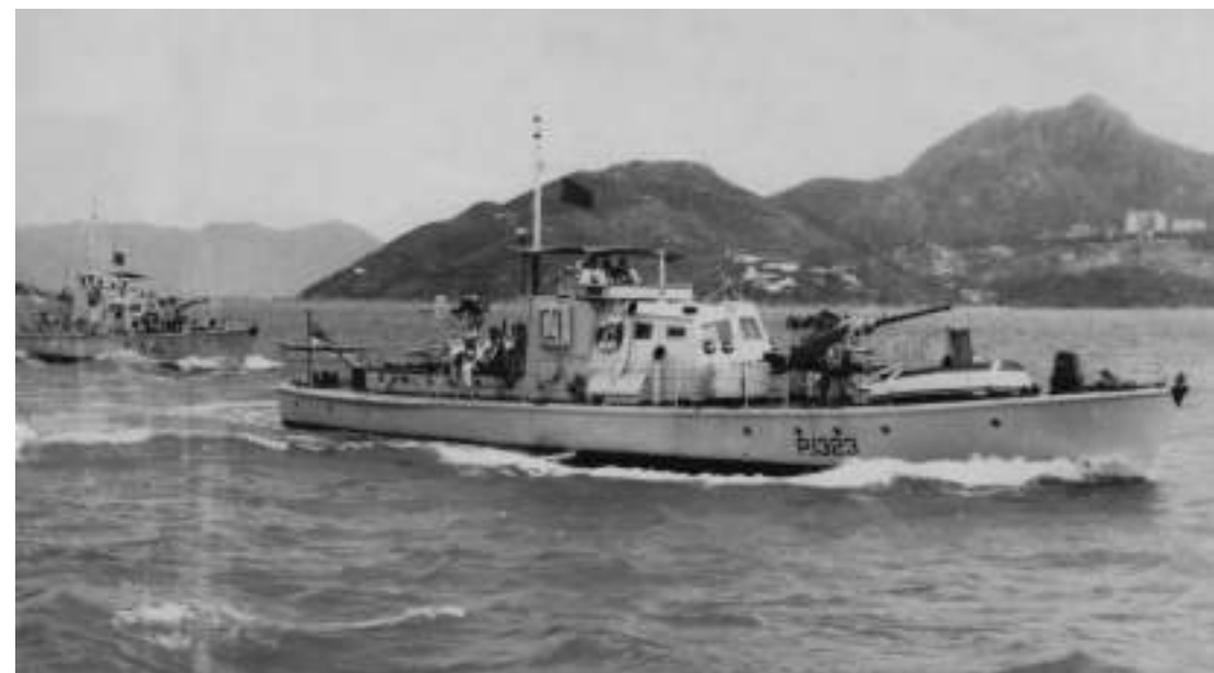
○ 早期香港艦隊的中堅：排水量 50 噸的沿岸巡邏艇，照片提供：John H. Fleming

在兵戎相見、冷戰高峰的 1950 年代，駐港海軍受到內地和台灣的兩路夾擊。一方面要擔心新中國成立後帶來的變數。雖然英國是率先承認中