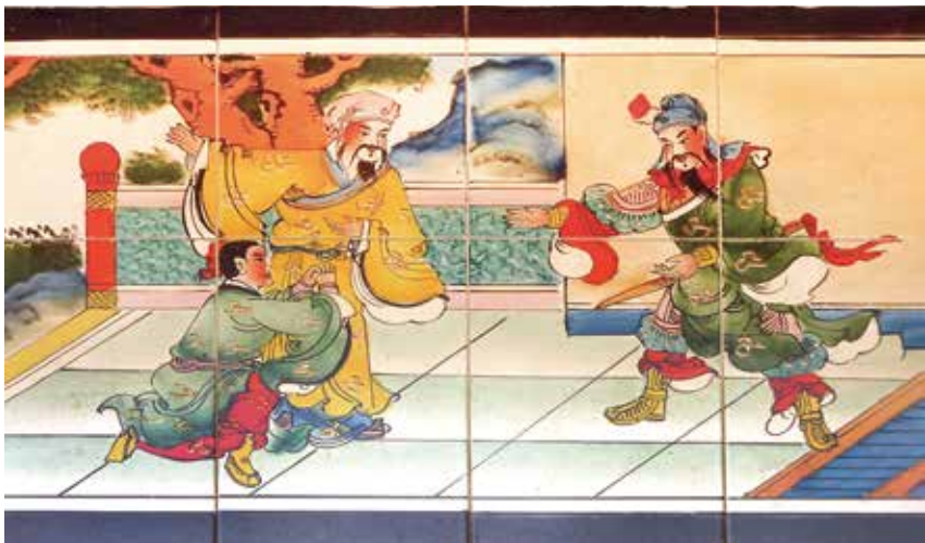
局部畫面，右方為關羽，左方下跪者為關平，黃衣人是關定。