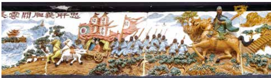
局部畫面，顯示兩位夫人坐在馬車上。

位於荔枝窩村廣場的協天宮，找到一塊雕工精美的陶塑，該陶塑左面題上「忠肝義胆關雲長」，刻畫關羽騎在馬上，一手拉着馬韁，長髯飄起，英姿颯颯，前面有十多個士兵在護送着劉備兩位夫人。兩位夫人坐在馬車上，關羽莫後。馬車沒有放下圍帳，可看到兩位夫人，眼望前方，神態自若。士兵分別舉起寫有「關」字、「漢壽亭侯」旗幟，該陶塑的釉色以黃、綠、藍、褐色為主。