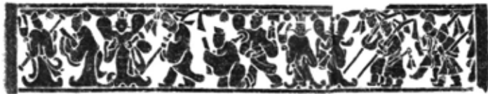
山東臨沂吳白莊漢墓中室南壁東門楣上的畫像石，描繪了帝辛閱簡、好勇征伐、比干死諫、沉湎于酒以及武王伐紂五個場景

商紂逃回朝歌，眼看大勢已去，當夜，就躲進鹿台，放了一把火，自己跳到火堆裏自殺了。