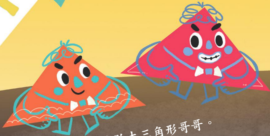
這是雙胞胎大三角形哥哥。