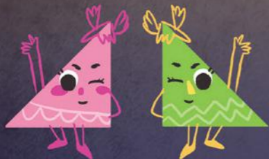
這是雙胞胎小三角形妹妹。