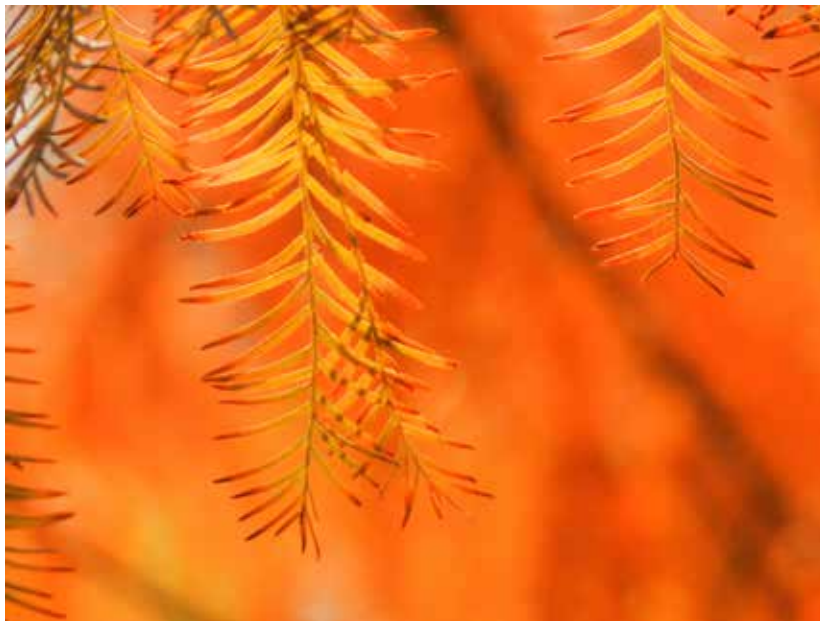
落羽松披上金黃色外衣