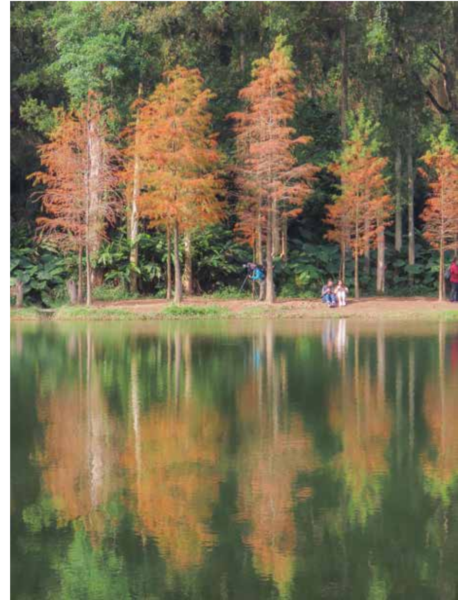
在水中央，有儂影一雙