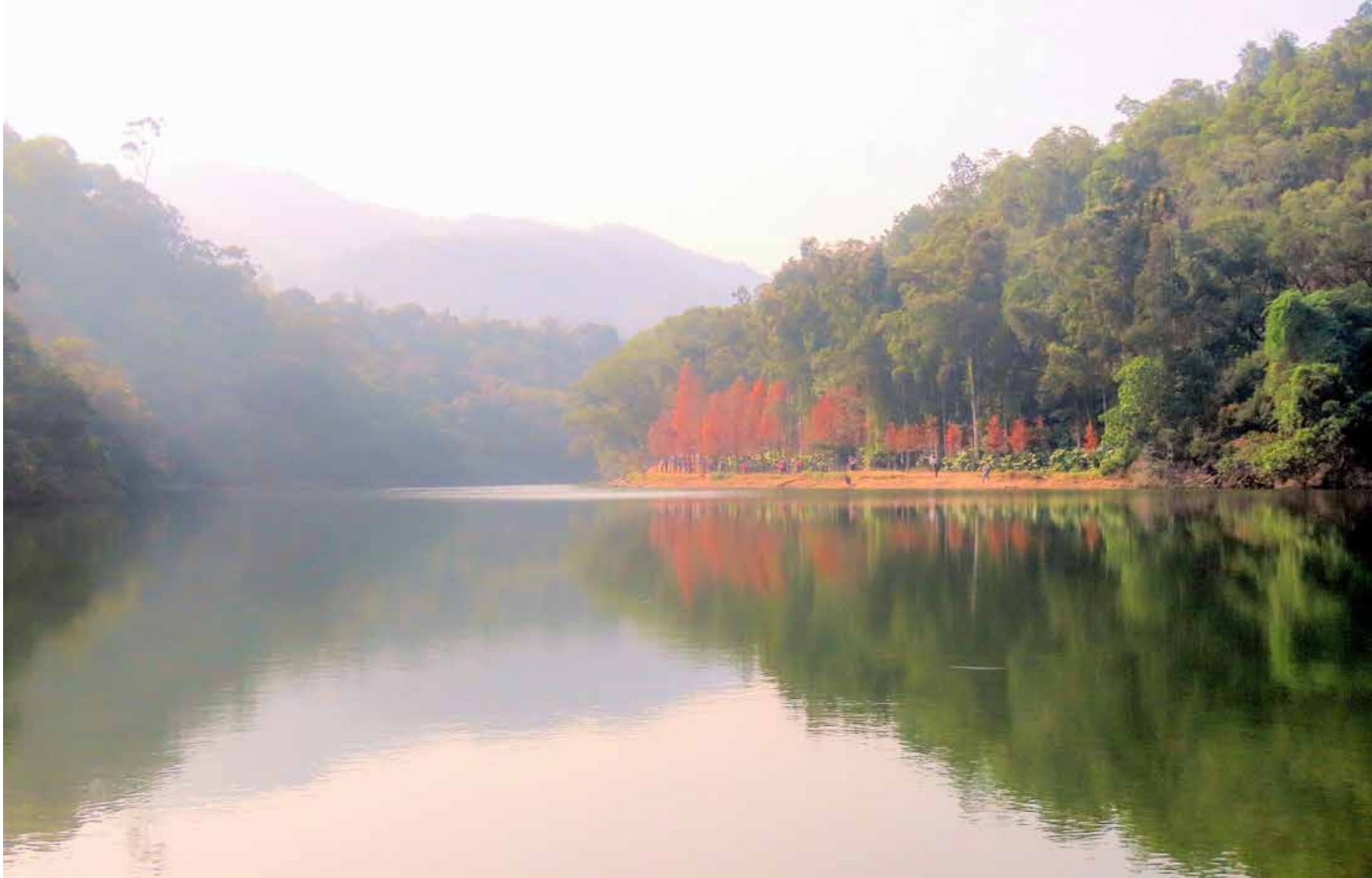
落羽松及山丘映照到水面，如詩如畫。