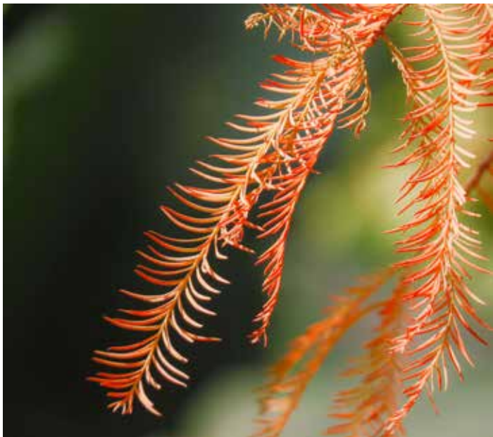
陽光落在金松葉上

人長大了，感覺時間過得特別快，不但一天很快便過去，一年也轉眼即逝，就是十年也溜走得無聲無息，要抓也抓不住。我記不得從那年開始，農曆大年初二便會跨家庭和兄弟姊妹聚會，大家聚首一堂，互相祝福，一家人齊齊整整吃過一頓豐富的午飯後，這大家庭中的每個小家庭都準備好賀年禮品互相送贈，有趣的是每個小家庭每年所選購的賀年禮品都很有默契地互相配合，以