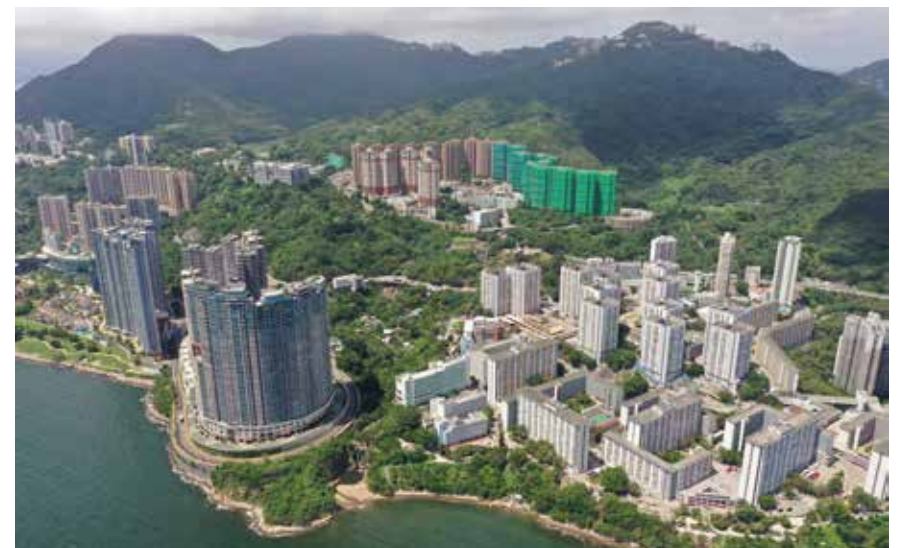
薄扶林村全景照片

本書共分為六章，目的為藉着探討薄扶林村舞火龍活動的紮作和儀式，發掘隱藏於儀式背後的社區歷史脈絡，並從當地舞火龍組織架構的發展演變，深入了解薄扶林村居民如何透過火龍活動凝聚彼此，並努力傳承這種社區文化。最後，我們希望透過觀察、記錄和爬梳文獻資料，整體、全面地了解「舞火龍」這項非遺項目的承傳現況，並提出對香港非遺文化的一點思考和討論，希望引起更多讀者對非遺項目的關注與興趣。