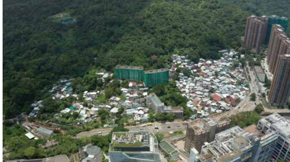
薄扶林村全景照片

舞火龍是舞龍文化的其中一項體現，若為舞龍文化窮源溯流，首先要理解龍在中國歷史上的崇高地位。自古以來，中國人一直信仰並祭拜着龍的圖騰，牠是中國最具代表性的神獸之一，其文化含義一向豐富。人們揮舞龍形作祭祀的舞龍文化源遠流長，至少在漢代已有文獻記載舞龍祈雨的儀式。按清代康熙時期