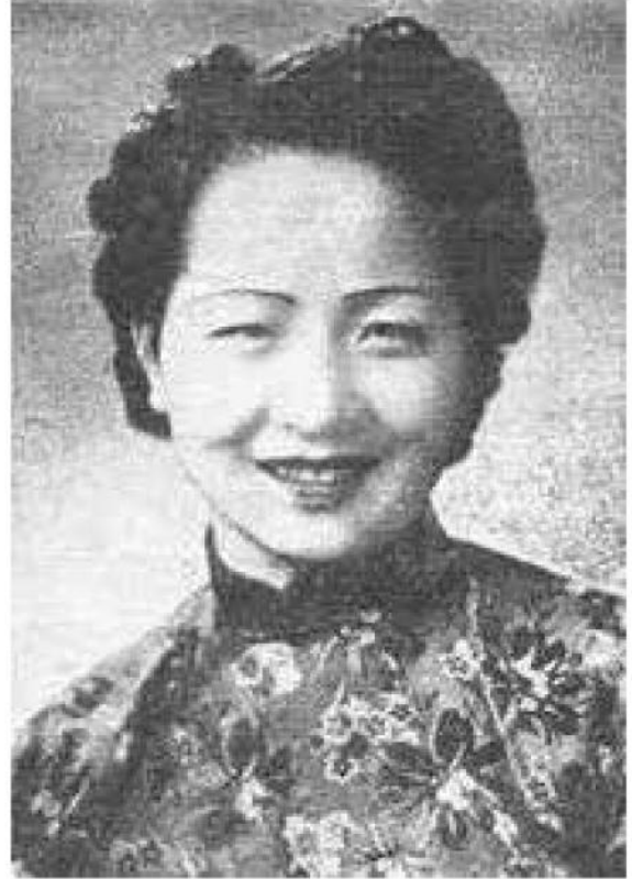
「中國的辛德勒」錢秀玲