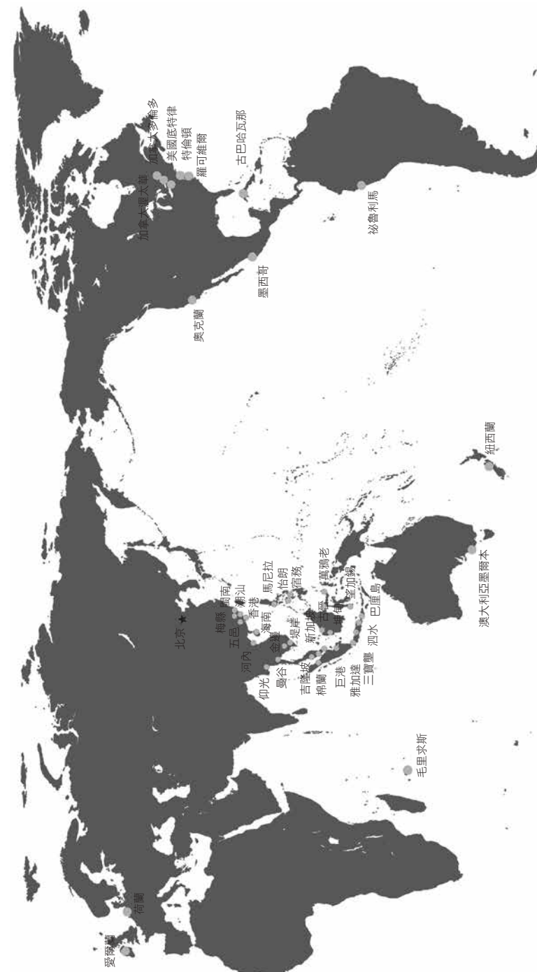
圖 1-2 中國東南沿海部分僑批（銀信）發生地的全球分佈