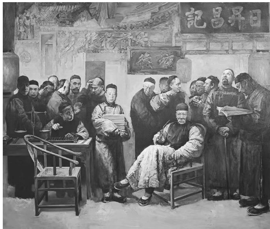
圖 1.1 日昇昌票號

第四，鏢局運現已不能適應越來越擴大的貨幣交易需要。在商品交易過程中，由於商人異地採購業務的不斷擴大，現銀調動額數也越來越大，次數亦愈來愈多，因此既安全又快速地運現就成為一個突出問題。鏢局就是在這種狀況下應運而生的專門運現機構。所謂鏢局，以「僱傭武藝高超之人，名為鏢師傅，腰繫鏢囊，內裝飛鏢，手持長槍（長矛），於車上或馱轎上插一小旗，旗上寫明師傅之姓，沿途強盜，看見標幟上的人，知為某人保鏢，某人武藝高強不敢侵犯。重在旗標，故名標局。」但是隨着社會的動盪，土匪四起，鏢局運現也不再安全。