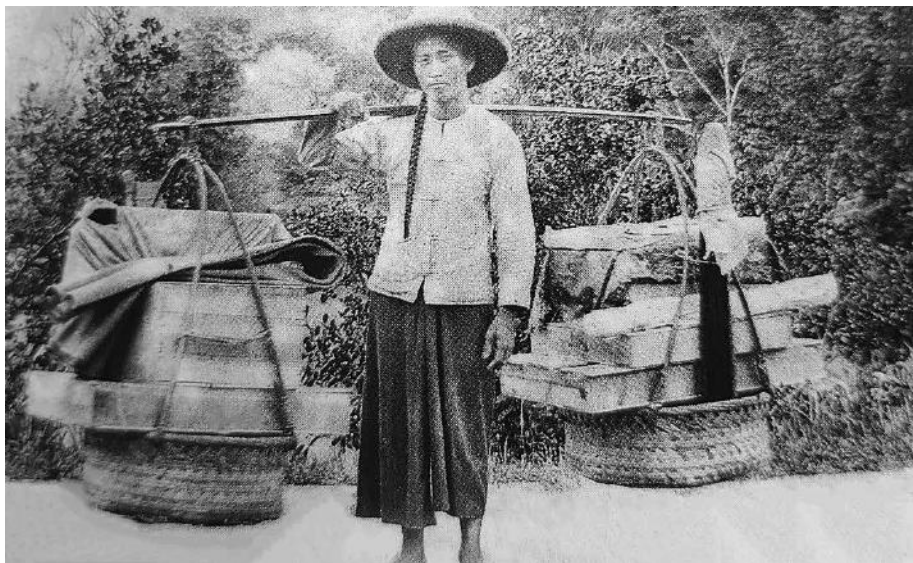
印尼街頭的華人小販，約攝於 1886 年