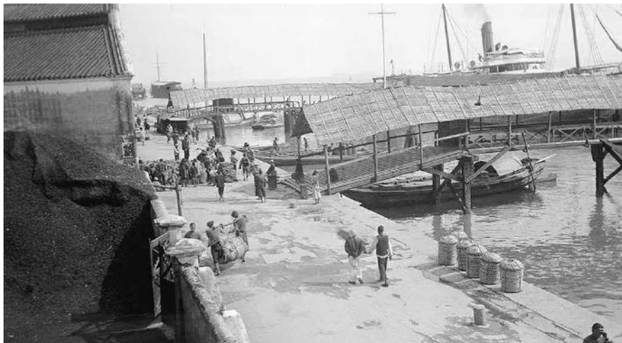
圖 1.3 19 世紀後半葉，汕頭港碼頭人來人往

18 世紀末，西班牙殖民當局為了開發菲律賓羣島，放寬了對中國移民的限制，泉州地區移居菲律賓者逐漸增多。到了 19 世紀 80 年代，全菲華僑人口達到 93567 人，其中馬尼拉有華僑約五萬人。