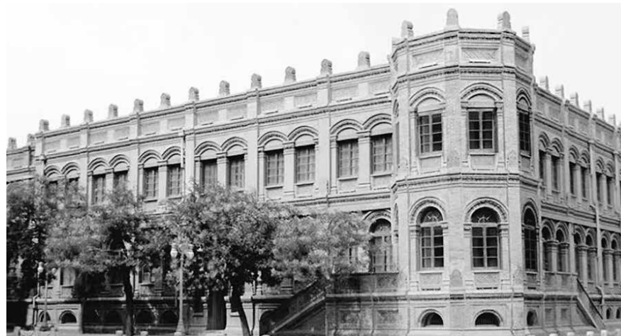
圖 1.2 天津民信局

不過，海外的銀信局，與國內的民信局還是有一定的區別。首先，在國內民信局的收寄信件中，寄信人並不一定同時需要寄錢，純粹寄信亦可；其次，收寄信件的郵費（俗稱「酒力」「酒例」「酒資」等）一般多為到付。而海外僑批局收寄批信，其重點是寄銀，信是附帶，批信的郵費基本都是