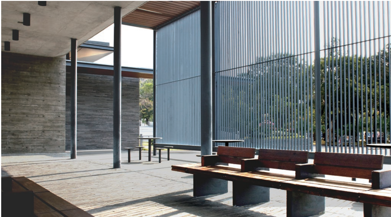
翻新後的摩士公園