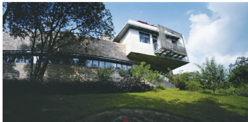
粉嶺大隴獸醫化驗所

另一原因，在香港做建築師還比不上「風水佬」受社會重視。試問大家在選購物業時，會否留意設計該樓宇的建築師是誰？難怪安藤先生未能在這裏開花結果……猶幸，香港不乏鍾情「安藤style」的建築師，還設計了不錯的簡約建築。喔，在那裏找到香港的「安藤忠雄」？