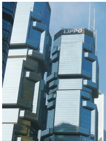
力寶中心由美國的 Paul Rudolph 設計，他最擅長凹凸的立面處理。

的大趨勢，尤其中國的龐大市場，引來不少外國建築師來港設立亞太區總部，增添多元色彩。