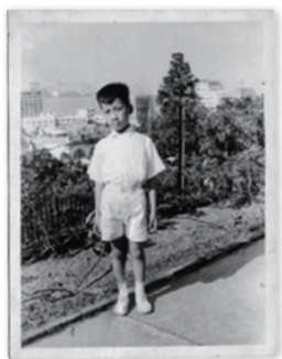
筆者在「兵頭花園」留影，後方遠處是50年代的維多利亞港。

每天下午四時，我愛跑到大笪地（即佔領角，今日的水坑口街）欣賞一位師傅以烤熱了的麥芽糖表演畫龍奇技。那裏很有特色，有相命、跌打、理髮、金魚檔及非常骯髒的「經濟飯店」，大時大節更有木偶神功戲。