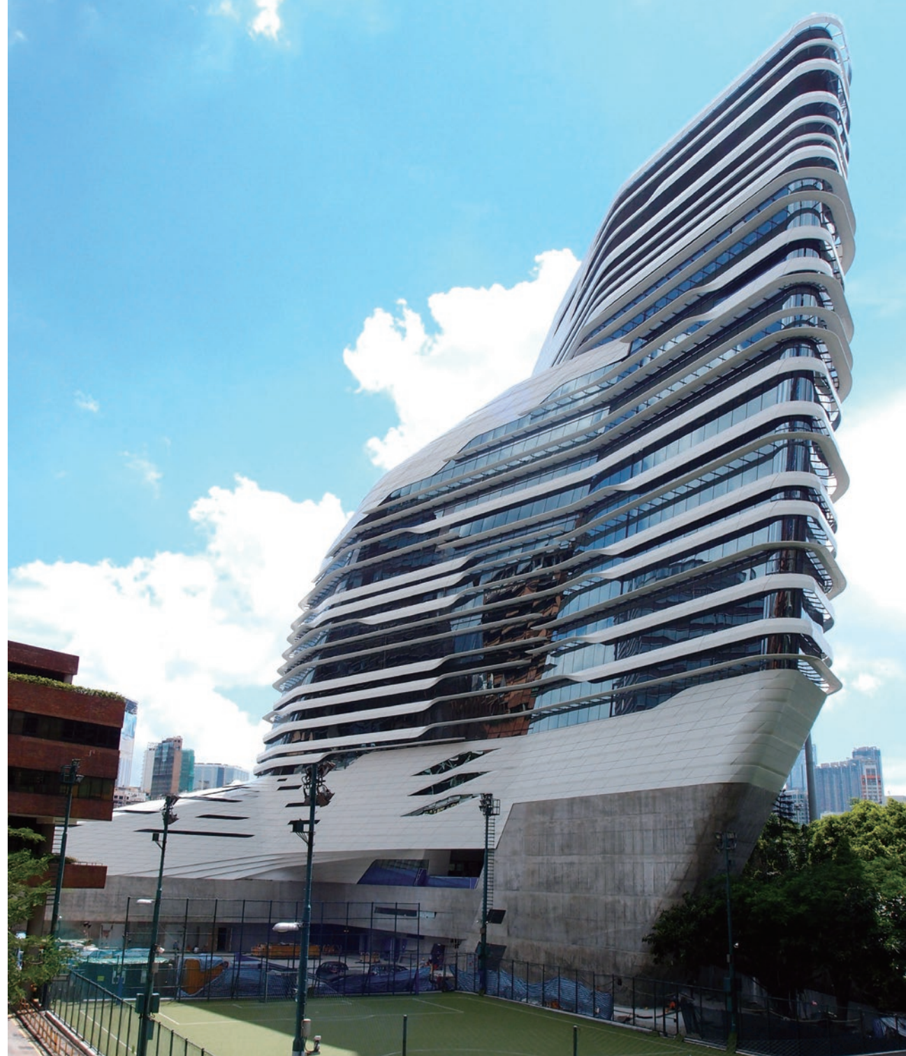
由 Zaha Hadid 設計的理大賽馬會創意藝術中心

欣賞建築，是一種廉宜的生活享受。在我們對建築增加認識之餘，會發現香港各區還有很多不錯的作品；尤其公共建築，已洗脫過去的惡劣評價，能讓我們耳目一新。