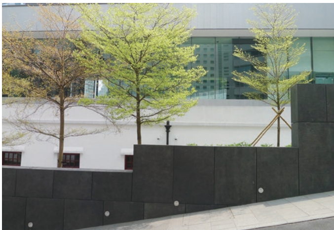
由夫妻檔建築師 Tod Williams 和 Billie Tsien 設計的亞洲協會香港中心。