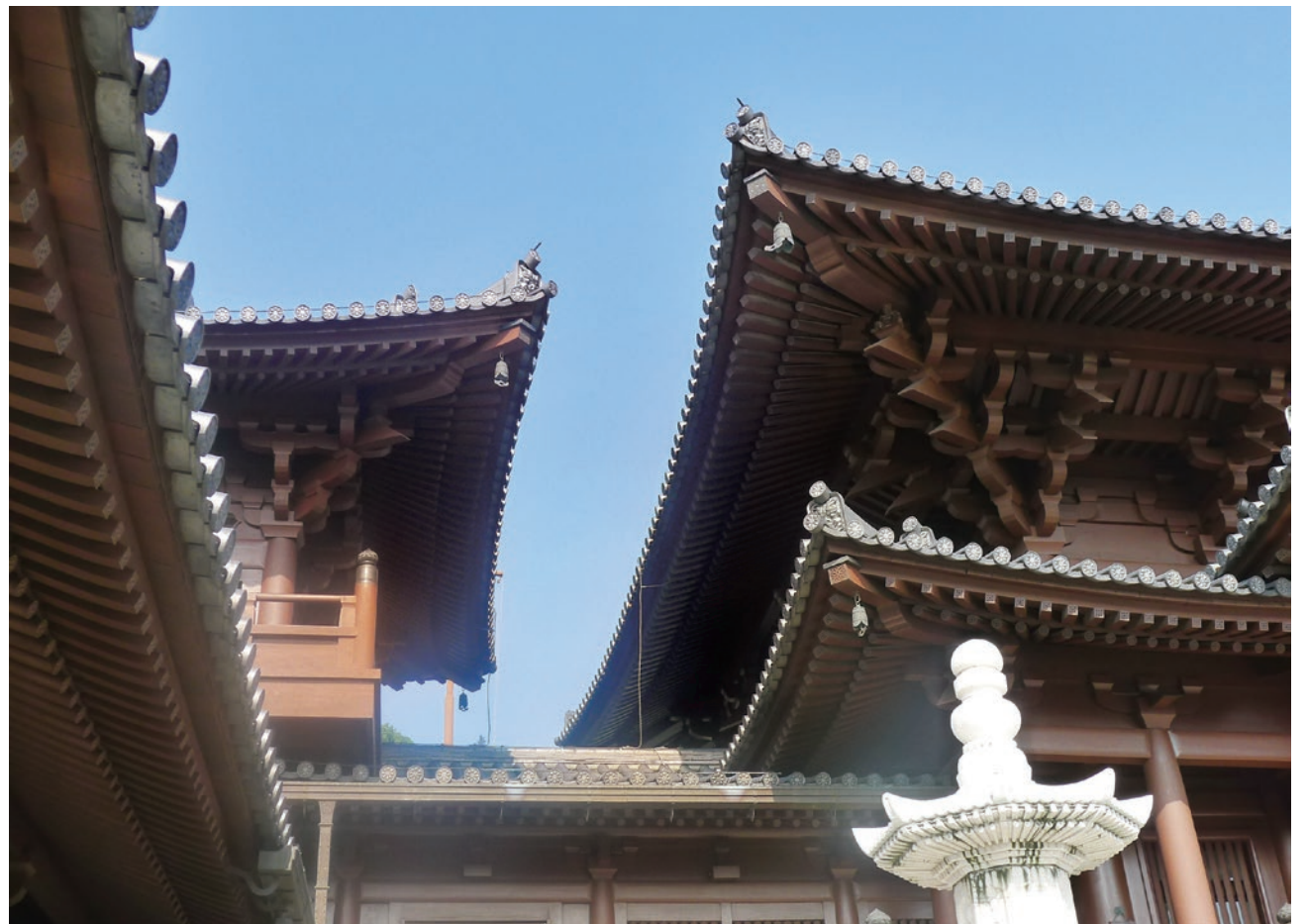
志蓮淨苑之屋簷下斗拱

當志蓮淨苑及南蓮園池相繼落成，卻完全改變了遊人對本地中國傳統建築那一向庸俗馬虎的觀感。志蓮淨苑的高規格要求，包括全部以檜木建造，及嚴格參照唐朝建築的佈局、形態、式樣、物料、雕像，以至於園景中的山、水、石、樹等造形，展示一絲不苟的傳統工藝與技術，令人嘆為觀止！故此，志蓮淨苑可以超越宗教的界限，先後被選為「香港十大優秀建築」及「十大最愛」，獲香港市民一致認同。