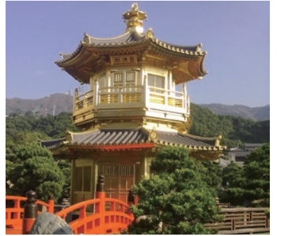
南蓮園池之圓滿閣