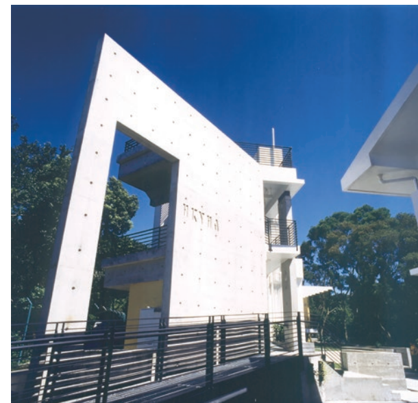
賽馬會摩星嶺青年旅舍