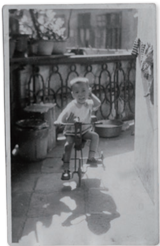
筆者攝於荷李活道唐樓，當時正在走馬騎樓踏單車。