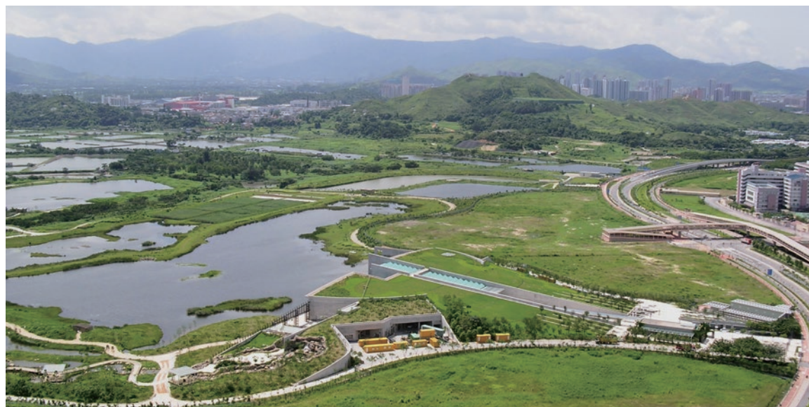
被完全綠化的香港濕地公園

香港得天獨厚，如此一個人口稠密的大城市，竟然還有一個世外桃源——擁有大片自然濕地的米埔自然保護區，可以觀賞候鳥。不要小看這個距離天水圍不太遠的「米埔內后海灣拉姆薩爾濕地」，它獲《拉姆薩爾公約》劃為「國際重要濕地」。佔地達1,540公頃，它的面積差不多有100個香港維多利亞公園般大；在冬季，不難看到上萬候鳥的浩瀚場面。筆者曾親眼目睹數以千計候鳥排成「之」字形，分梯隊飛越頭上的震撼效果，霎時有如置身非洲的錯覺。除了在米埔，香港濕地公園亦是觀鳥的好地方。為何香港要建這個觀鳥景區？