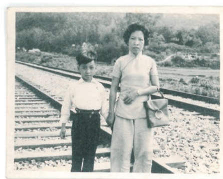
我第一次「遠征」，是跟媽媽回鄉向婆婆交代父親的後事，並補辦一些悼念先人的傳統禮儀。過程很驚嚇，所以從小便很怕鬼。

母親憶述，我們一家原住中環嘉咸街的板間房，父親32歲身故後，我只知道從小寄居在親戚的唐樓，位於荷李活道245號。附近有東街、西街，