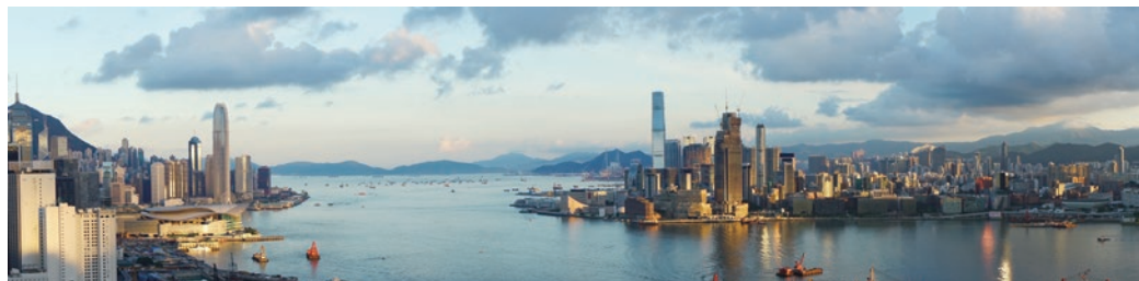
IFC與ICC都被視為香港的gateway。