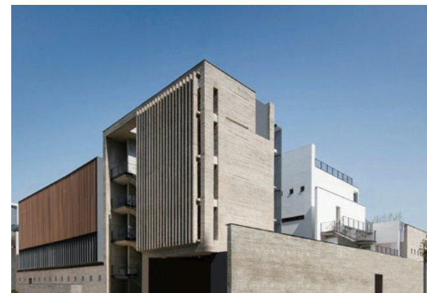
保良局何壽南小學（啟德新校）

以上例子，反映灰冷而樸素的表現形式不太迎合商業市場，但卻適用於平實的公共項目，因此早於七十年代，已成為政府建築師的楷模；包括位於中環半山的高級公務員宿舍 Hermitage 及伊利沙伯醫院護士宿舍（李銘根）、九龍醫院（黃漢威）等，都是當年經典之作。八九十年代，由於標榜復古裝飾的後現代主義盛行，簡約潮流漸趨式微。