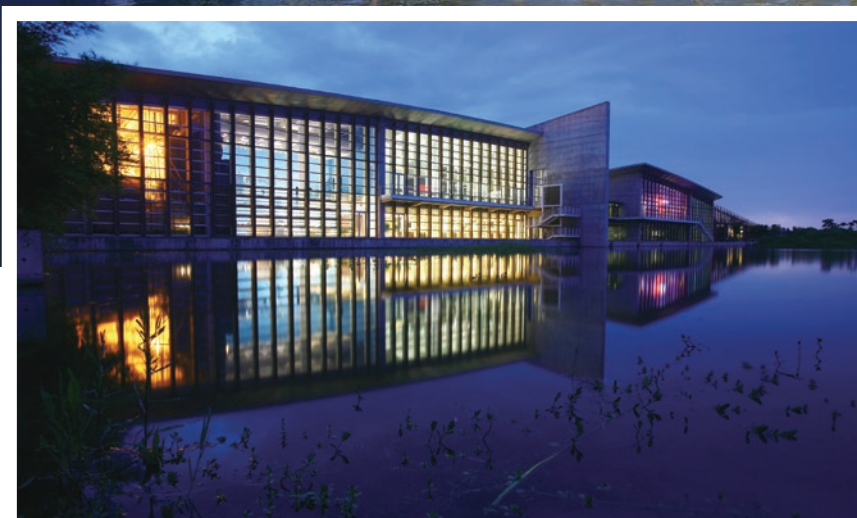
香港濕地公園夜景