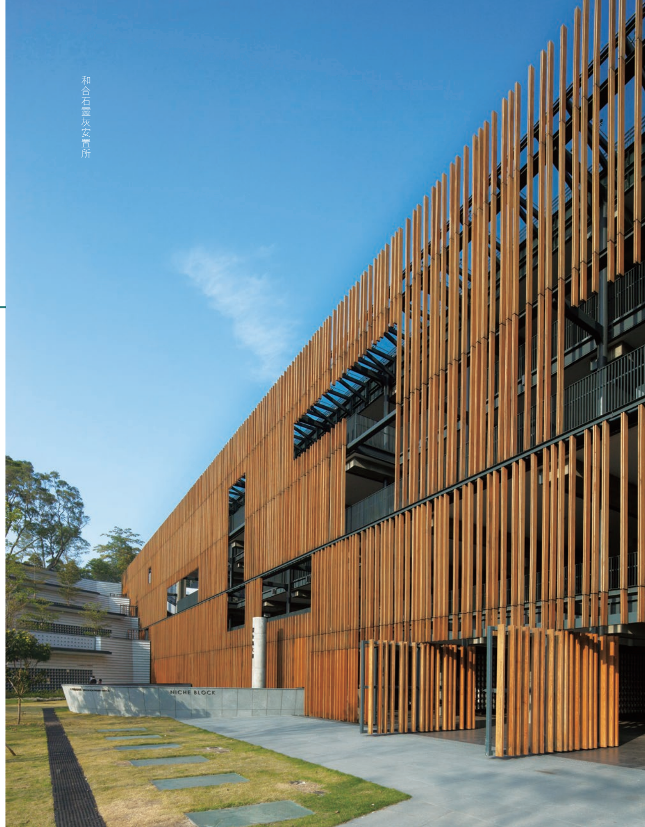
和合石靈灰安置所

反觀香港，真正欣賞安藤忠雄建築風格的以青年人居多。本地的發展商及城中名門望族，恐怕不易接受他那灰沉沉的水泥素面 (fair-face concrete) 或內地稱為「裸」的建築。在大部分人眼中，建築即是商品，對