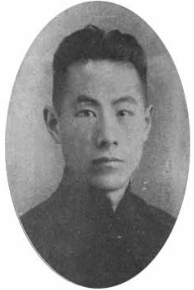
張伯駒（一八九八—一九八二）